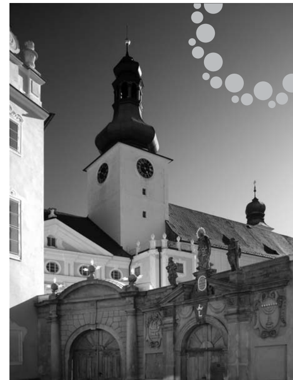
Klášteří kostel sv. Vojtěcha, Broumov

Smyčcový sextet napsal Bohuslav Martinů během jednoho květnového týdne bezprostředně po dokončení Sinfonie concertante pro dva orchestry v r. 1932. V třívětě skladeb rámují dvě rychlé, rytmické věty, střední kontemplativní větu pomalou. Dílo si udržuje vnitřní rovnováhu také tím, že každá z vět sleduje třídílnou formu, v níž je třetí díl částečně vždy návratem dílu prvního. Později Martinů dílo přepracoval přidáním partů kontrbasu a rozšířil tak sazbu na komorní symfonii. Skladba v původním obsazení získala 1. cenu v soutěži Elisabeth Sprague Coolidge v Americe, kam ji Martinů anonymně zaslal. Soutěže se zúčastnilo 145 skladatelů a Martinů zároveň získal i finanční odměnu 1000 USD.